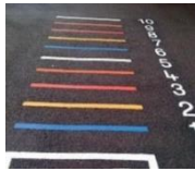
TABLA DE SALTO