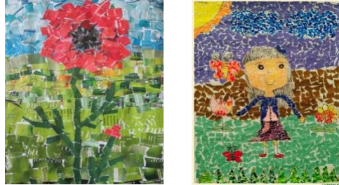
Imagen de ejemplo:

► Área Curricular: Artes Visuales Plástica