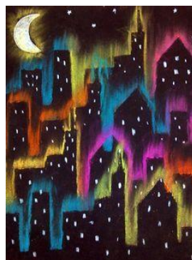
Imagen de ejemplo de actividad a realizar:

Para terminar utilizar tiza color amarilla o blanca para pintar las luces de las ventanas, estrellas y luna. Finalizada la actividad registrar fotográficamente el trabajo y enviar a la seño de sala.