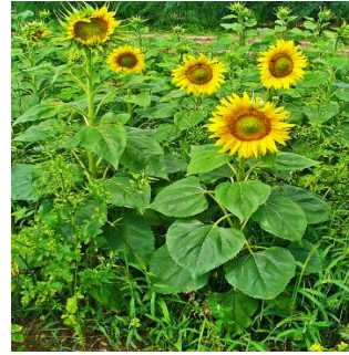
Planta de girasol.

Después los invitamos a realizar en familia un collage libre hecho con diferentes semillas, utilizando, plasticola y algún soporte como papel o cartón, para luego compartir con la docente la producción.