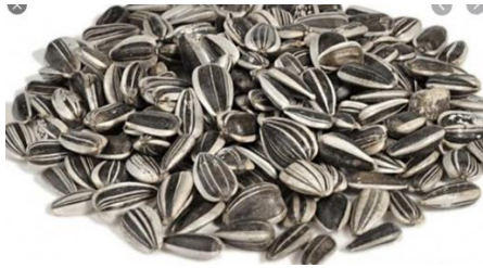
Semillas de girasol.