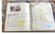
Modelo del cuaderno de viaje

Un cuaderno de viaje es un cuaderno que nos acompañará en nuestro viaje y en el que haremos anotaciones y dibujos. Más tarde lo decoraremos con fotografías y todo lo que tengas a mano esos días :ticket,entradas,servilletas etc.