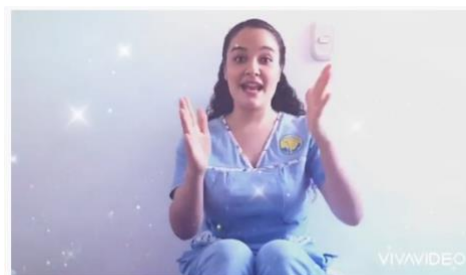
Aserrin aserran - Percusion corporal para niños de jardín y transición.#juegoritmico

https://www.youtube.com/watch?v=pKz6LzOU7pU