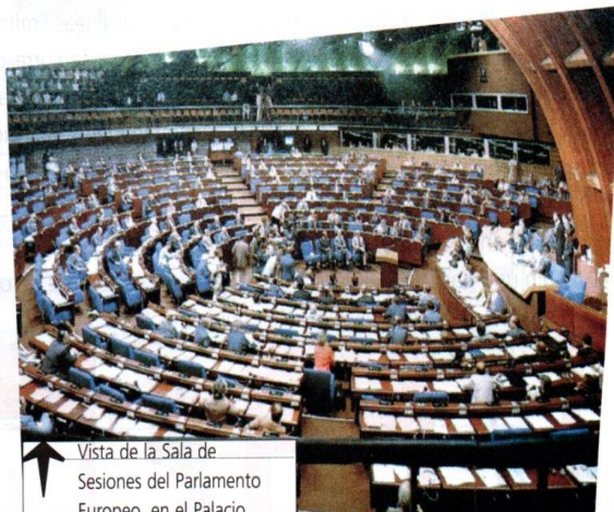
Vista de la Sala de Sesiones del Parlamento Europeo, en el Palacio de Europa, ciudad de Estrasburgo, Francia.

Hay distintos tipos de Estados (unitario, federal, confederado, etc.), de sistemas políticos (democracia, autocracia) y de formas de gobierno (república, monarquía). El sistema político más difundido en el mundo es la democracia.