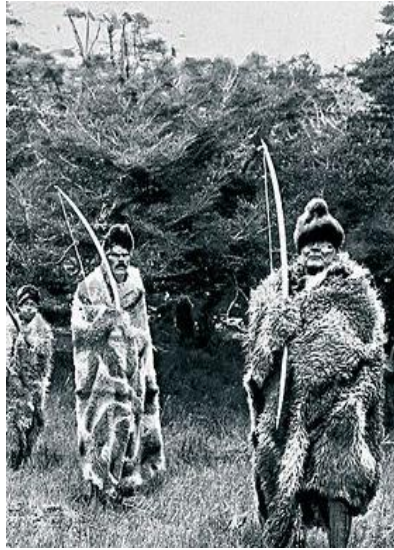
Sur Argentino: Selk'nam