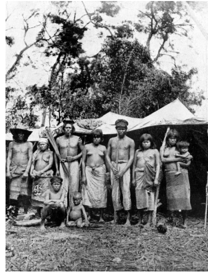
Noreste Argentino: Guaraníes

Presentación: Será evaluado al retorno de las clases en la escuela.