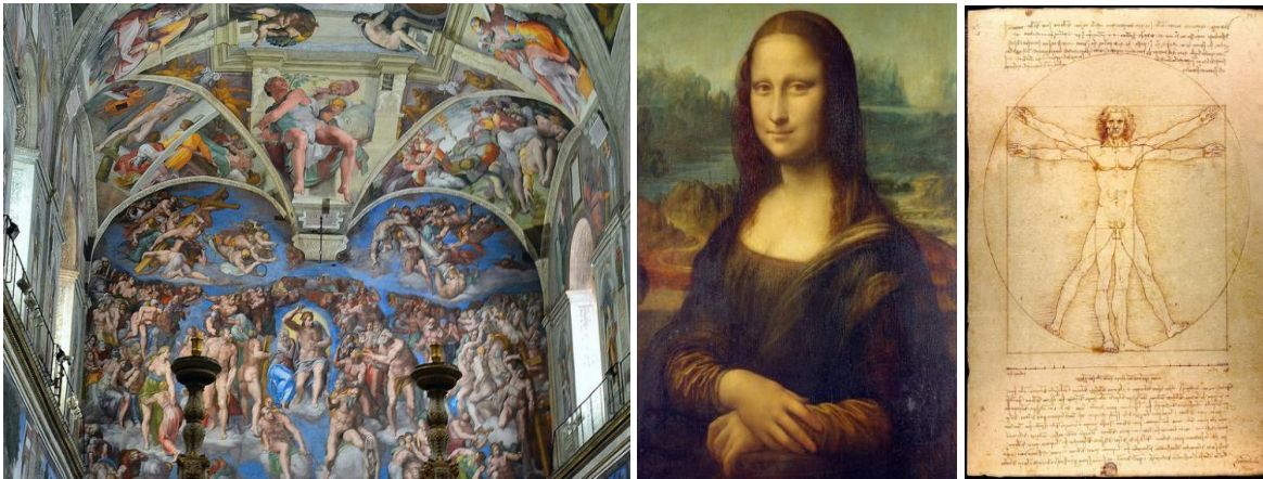
“Capilla Sixtina” de Miguel Ángel en Roma. “La Mona Lisa” pintura de Leonardo Da Vinci, el “Hombre de Vitruvio” también del mismo Leonardo Da Vinci, donde muestra las proporciones físicas del ser humano, fue uno de los grandes logros del Renacimiento.