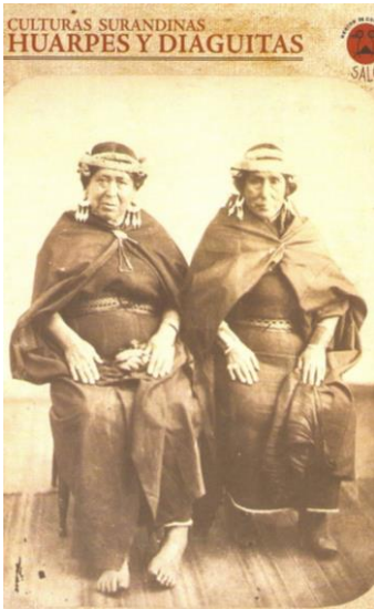
Noroeste Argentino: Diaguitas