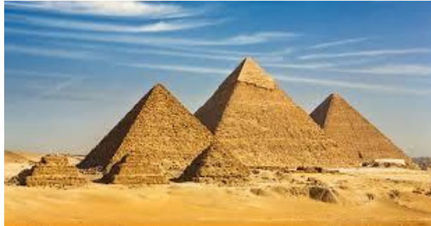
Pirámides de Egipto.

4. Según la información que se indica en la pág. 35 y 36. Elabora una lista con las características culturales de los egipcios.