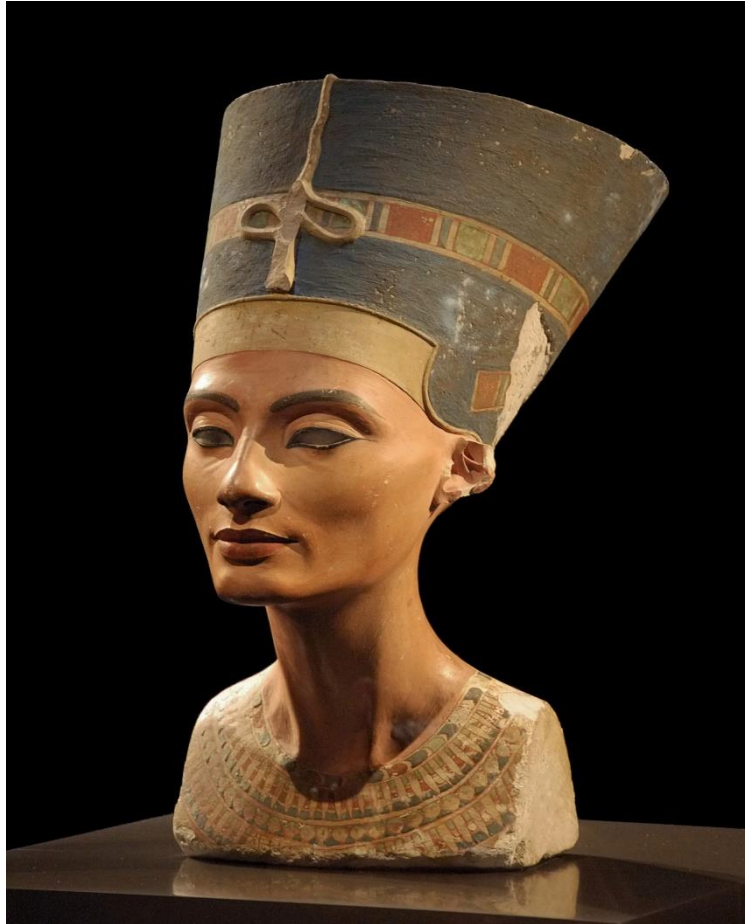
Nefertiti, faraona del Antiguo Egipto.

10. Elaborar las actividades 1, 2, 3 y 4, de las págs. 55 y 56. Para poder realizarlo debes leer atentamente las págs. 50, 51 y 52 del texto titulado “La mujer en la antigüedad”.