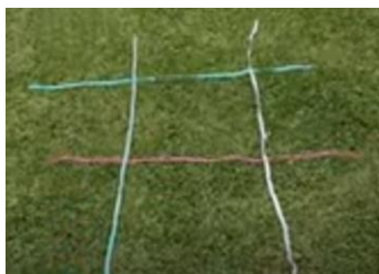
Imagen N 1

A la voz de: ¡LISTOS YA! Buscar y correr con una tapita en la mano y colocarla en alguno de los cuadrados formados, luego correr de vuelta a buscar otra, y así seguir hasta completar todos los cuadrados. Gana el participante que logre hacer TA-TE-TI, o bien tenga mayor cantidad de tapitas colocadas en el espacio marcado. Recordar, una sola tapita por cuadrado.