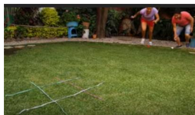
Imagen N 2