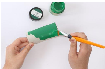
PASO 1 (PINTA)