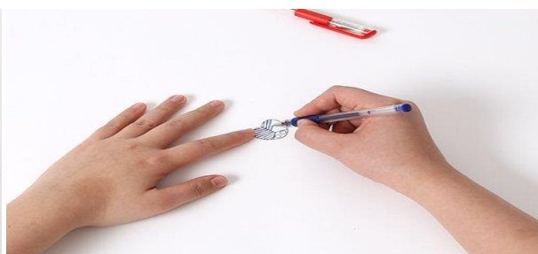
PASO 2 (DIBUJA LA MOSQUITA)