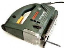
Sierra de metal