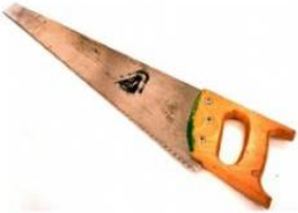
Tijeras de electricista