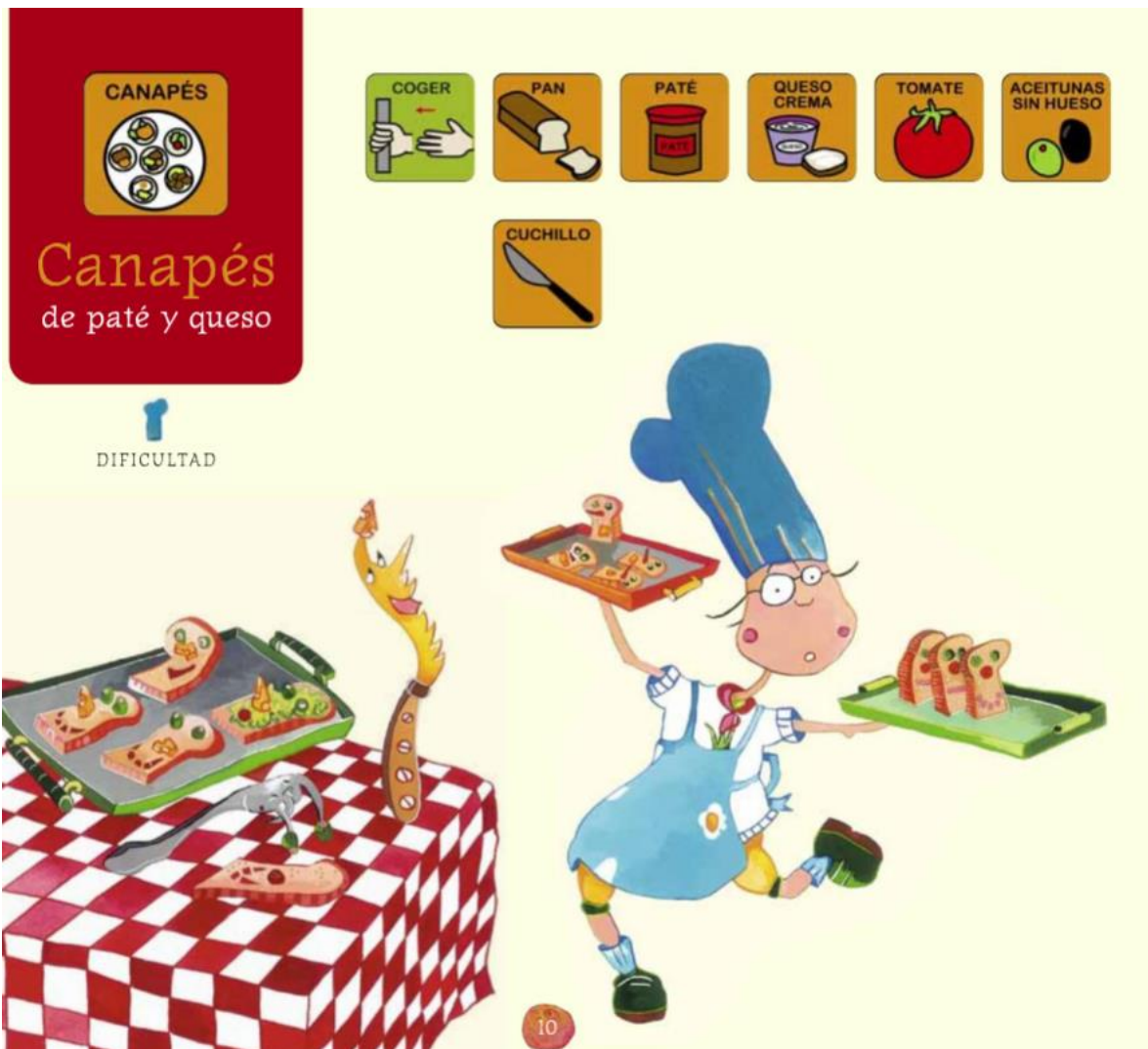
Página Nicolás Cocina sin fuego.