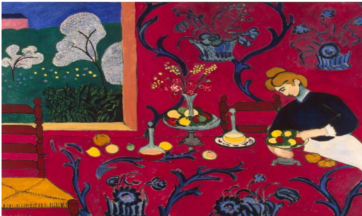
LA HABITACIÓN ROJA, óleo sobre lienzo, 1908.

espaciales (arriba, abajo, al lado debajo adentro de, lo cercano lo lejano) Luego pintar lo dibujado.