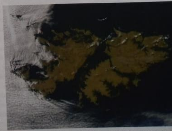
A partir de 2005, el gobierno malvinense otorga permisos para explorar y extraer petróleo en las islas sin consultar al gobierno argentino. Como las islas son argentinas y no inglesas, puede decirse que los malvinenses obtienen dinero por explotar recursos naturales que no les pertenecen.

* Libre determinación: es un principio jurídico internacional que reconoce el derecho de cada pueblo a decidir su futuro político.