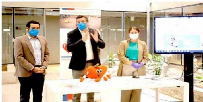
Instituciones de gobierno, elaboraron plan para combatir la obesidad producto del encierro por el Covid-19.

“Nos preocupa que muchas personas puedan estar haciendo aislamiento personal, por razones de la autoridad o voluntario y probablemente sus conductas o hábitos saludables caen en el último nivel de prioridad. Nosotros queremos que sigan siendo prioridad. Parte importante de lo que está haciendo Elige Vivir Sano, es acercando los contenidos necesarios para que las personas sepan cómo alimentarse bien, cómo hacer prácticas saludables en las casas, qué prácticas saludables pueden realizar para que efectivamente la ali-