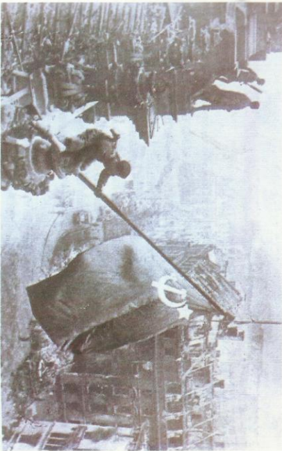
Las tropas soviéticas fueron las primeras en llegar a Berlín y colocaron la bandera roja en la cúpula de la Cancillería, el despacho de Hitler.