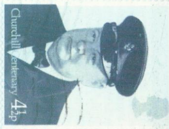
El primer ministro inglés, el conservador Winston Churchill, fue uno de los líderes del bando aliado y uno de los grandes protagonistas de la Segunda Guerra Mundial.

El 6 de agosto de 1945 en Hiroshima, y el 9 en Nagasaki, dos bombas atómicas terminaron de aniquilar al Japón.