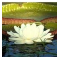
FLOR DE IRUPÉ