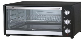
C) HORNO ELÉCTRICO