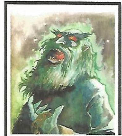
Ilustración del supuesto fantasma de Canterville.

El asombroso episodio ocurrió el miércoles por la noche cuando la familia Otis que se encontraba buscando a su hija Virginia perdida en la inmensidad de la mansión, se toparon con un pasadizo secreto. Luego de atravesarlo hallaron un esqueleto humano tirado en el piso atado con cadenas de pies y manos. Después de radicar la denuncia correspondiente y tras de cinco días de intensa investigación, los especialistas aseguraron que en un 99 % el cuerpo pertenece a Lord Simon de Canterville, desaparecido hace más de 300 años.