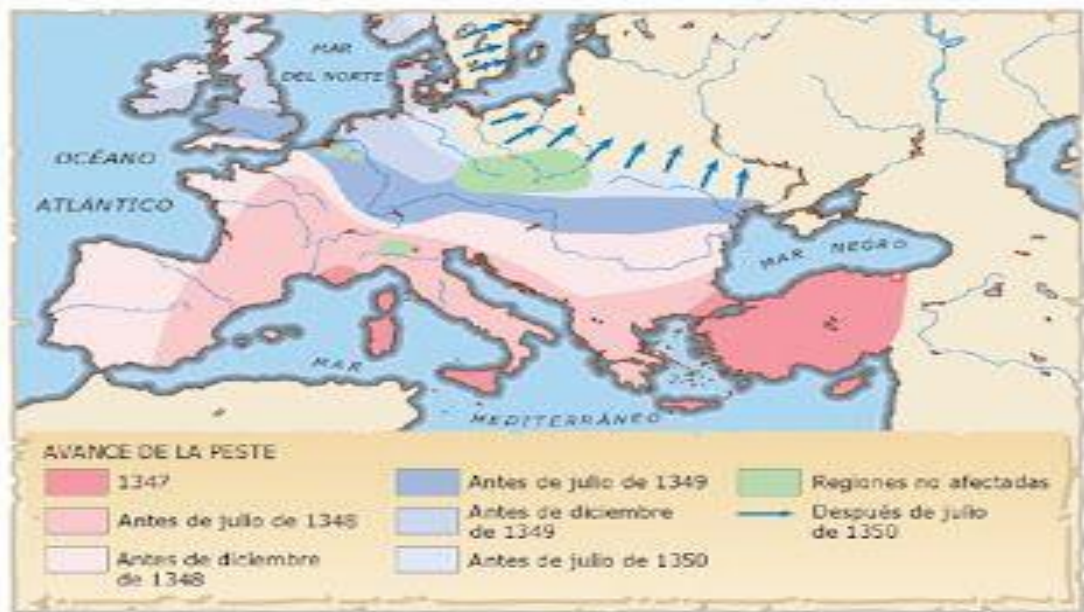
La expansión de la peste negra en el siglo XIV

f) Con la ayuda de los mapas, identifica los lugares de la expansión de la peste negra.