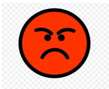
Imagen a modo de ejemplo

¡A descubrir los colores! En familia, observar las siguientes imágenes y responder: ¿De qué color es la carita alegre? ¿De qué color es la carita enojada? ¿De qué color es la carita triste? ¿De qué color es la carita que guiña un ojo? Con ayuda de un adulto, representar frente a un espejo, las emociones que transmiten los colores que observaste en las caritas. ¡Qué hermoso te ves!