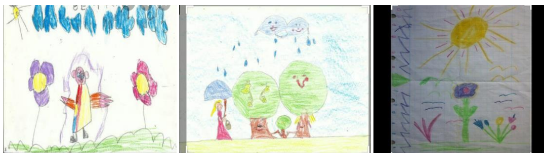
Imagen a modo de ejemplo.

¡Dibujo lo que veo! Hoy vas a dibujar lo que observaste en la actividad anterior al aire libre. Con ayuda de mamá, marcar en una hoja blanca, una línea, dividiendo la hoja a la mitad, luego invitar al niño a dibujar lo que observó en la actividad N°5, arriba de la línea, el sol y el cielo, abajo de la línea el pasto, plantas, árboles, flores, y si observaste animales, dibujar arriba de la línea los que vuelan y abajo de la línea los que caminan. ¡Qué hermoso tu dibujo! ¡Me encantó!