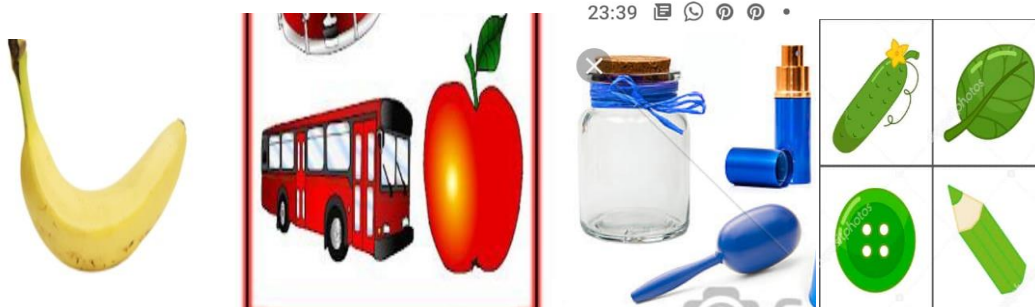
Imagen a modo de ejemplo.

¡Que genial como aprendiste los colores! ¡Me encanta como cuentas!