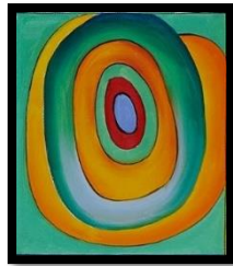
Imagen de ejemplo:

1-b). Luego de saludarnos continuar con la confección de nuestro juego.