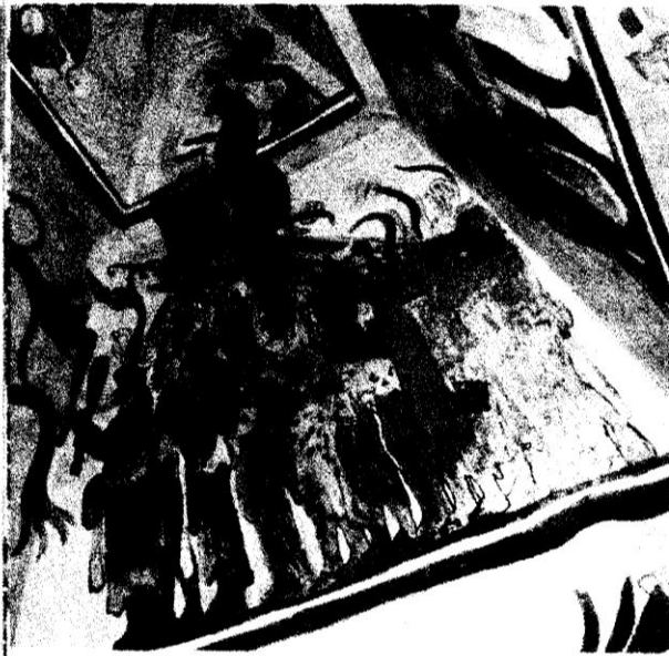
Fresco maya que muestra la celebración de un triunfo militar. Fue realizado en Bonampak (actual Chiapas) durante el siglo VIII.