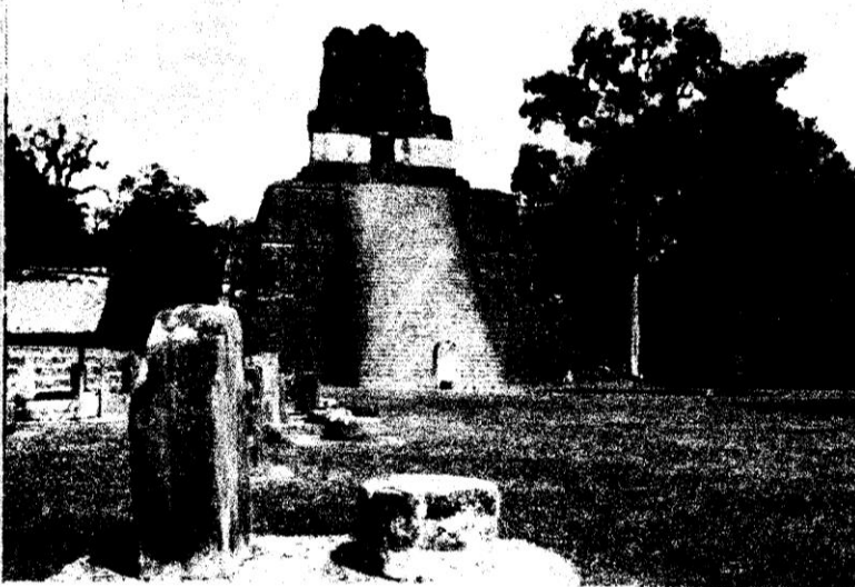
Ruinas de Tikal. Las ciudades mayas tenían una relativa autonomía y se alternaron en el dominio de la región.

A la llegada de los españoles, sin embargo, muchas de estas ciudades habían desaparecido después de una prolongada guerra civil. Esta fue una de las causas de la decadencia de la civilización maya, aunque los historiadores también explican su misterioso final por un conjunto de factores concurrentes con la guerra: el descenso de la natalidad, la degradación del ambiente que ocupaban y la violencia que caracterizaba las relaciones entre los grupos sociales y las ciudades.