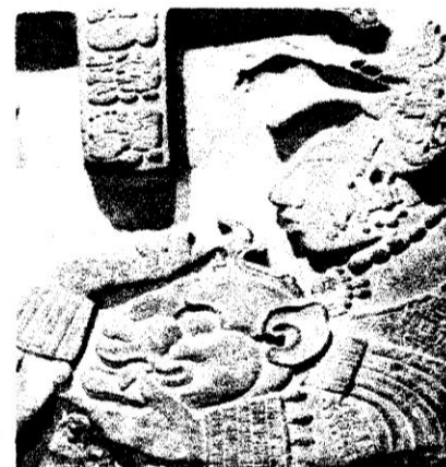
Ilustración que representa a un sacerdote maya, ataviado con una vestimenta ritual. Tanto las plumas como la cabeza del jaguar tenían un significado religioso.

De acuerdo al texto leído previamente, responda las siguientes preguntas: