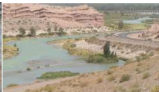
Río San Juan

2-Observar con atención y escribir indicando qué paratextos encuentras en el texto que acabas de leer: -----