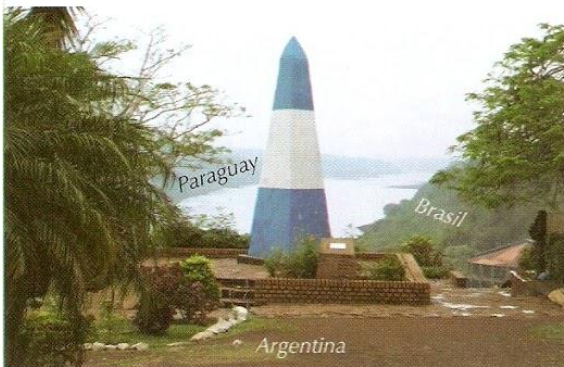
Hito argentino del punto tripartito entre la Argentina, Brasil y Paraguay en la confluencia del río Iguazú con el Paraná.

Una de las funciones que cumple la frontera es la de controlar a las personas y a las mercaderías que cruzan los límites internacionales. Estas tareas incluyen, entre otras, contabilizar la entrada y salida de habitantes, impedir la propagación de enfermedades o evitar el acceso de vegetales o animales contaminados al país.