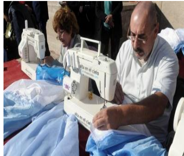
MAQUINA DE COSER