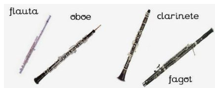
Instrumentos de viento, madera