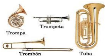
Familia de la Trompeta, viento metal