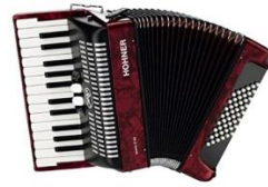
Acordeón a piano