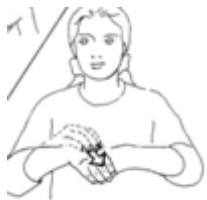
LAVARSE LAS MANOS.