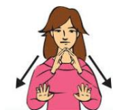
QUEDATE EN CASA-