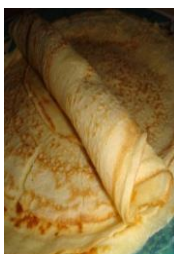
Masa para panqueques

Actividad: Rellenar con dulce de leche repostero.