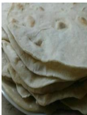
Masa de tacos estilo rapidita

Actividad: Preparar las guarniciones que se desean.