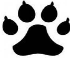
Huella de gato