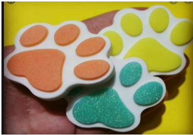
Imagen a modo de ejemplo de los sellos.