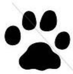
Huella de conejo