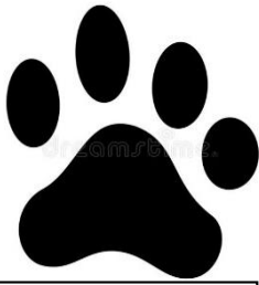
Huella de perro