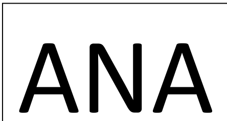
Cartel con el nombre

En esta propuesta se trabajará el nombre propio, para ello se proporcionará cartel con el nombre en imprenta mayúscula, el cual el alumno deberá copiar en una hoja y luego decorar la misma con trocitos de papel de colores, de revistas, de diarios, etc.