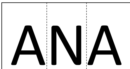
Cartel con el nombre para recortar

Utilizamos el cartel con el nombre propio de la actividad anterior, para realizar un rompecabezas. El alumno como pueda deberá recortar letra por letra, tratar de armar su nombre y pegarlo en la hoja .