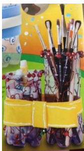
imagen de ejemplo:

Al finalizar esta actividad, registrar fotográficamente y enviar a la seño de la sala.