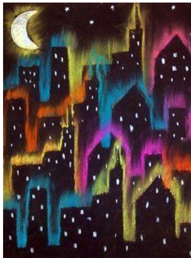
Imagen de ejemplo de actividad a realizar:

Finalizada la actividad registrar fotográficamente el trabajo y enviar a la seño de sala.