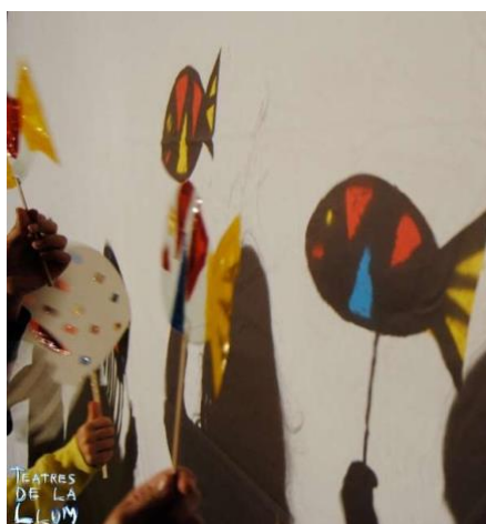
Imagen de ejemplo:

Finalizada la actividad registrar fotográficamente el trabajo y enviar a la seño de sala.