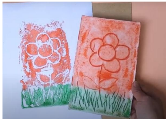
Grabado sobre plancha de Telgopor

A continuación, se mostrará algunas imágenes a modo de ejemplo: