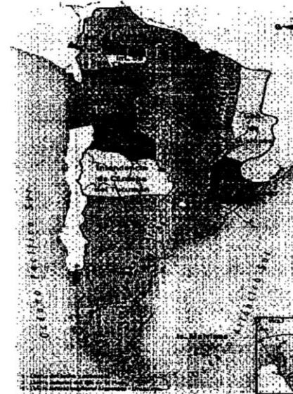
FIG. 1. VIRREINATO DEL RÍO DE LA PLATA

La llegada de Carlos III al trono de España tuvo grandes repercusiones en el actual territorio argentino. Una de sus medidas fue la creación del Virreinato del Río de la Plata.