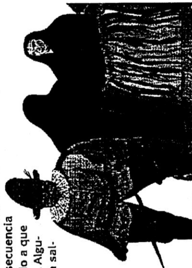
Españoles en la época colonial, según una ilustración del cura jesuita Florian Paucke.

Los Indígenas, sin acceso a derechos cívicos, fueron muriendo como consecuencia del trabajo forzado a que fueron sometidos. Algunos huyeron para salvar sus vidas.