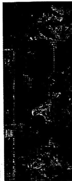
El lugar de reunión de los mestizos eran las pulperías, que ya estaban de moda. Por ejemplo, en la famosa "esquina colorada" de Desamparados (o Puyuta) había una pulpería de los jesuitas, donde vendían sus propias elaboraciones: vino, aguardiente, jobón, pan y frutas.

Los festejos preferidos eran los de carnaval (la chaya y los disfraces) y también las riñas de gallos, las corridas de toros y las carreras de embolsados.