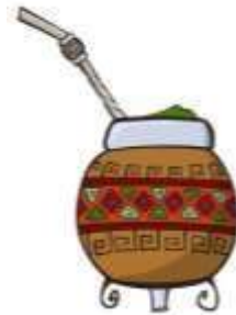
Mate -Dibuja, recorta y