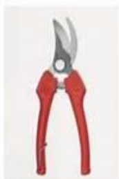
Tijera de una mano de corte deslizante, permite cortes hasta 2 cm de diámetro

En todos los casos, las herramientas deben permitir un corte limpio, sin desgarrar la rama, para lo cual deben estar bien afiladas. Luego de su utilización se deben limpiar, desinfectar y lubricar para su mejor conservación. La desinfección es importante por la transmisión de enfermedades de una planta a otra y se puede realizar con alcohol etílico o con agua lavandina al 50%. Las superficies de corte de más de 5cm de diámetro deben ser selladas con pintura al agua con fungicidas o algún producto cicatrizante.