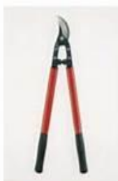
Tijera de dos manos de corte deslizante, permite cortes hasta 3 cm de diámetro