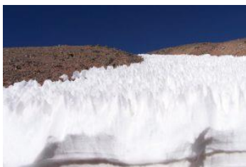
Glaciar en San Juan