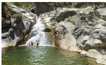
Cascada en Astica