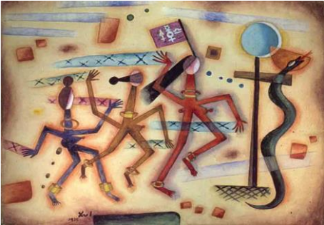
PANACTIVISTA, XUL SOLAR

2- El/la familiar a cargo, mostrará desde su celular la siguiente imagen de la obra de Xul Solar, que la docente enviará por WhatsApp: