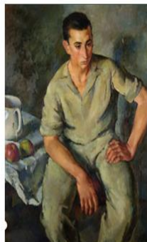
FIGURA DE MUCHACHO