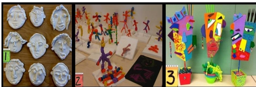
Imagen 2: Utilizar de base un telgopor, pinchar en él un alambre para modelar sobre el mismo la masa de sal y crear la escultura.

Imagen 1: Trabajar sobre una base de cartón, no olvidar colocar plástica a cada rostro de los integrantes de tu familia, para que queden sujetos a la superficie.