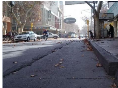
El centro del Gran San Juan.

La Dirección de Protección Civil informó sobre la ocurrencia de viento Zonda en horas de la tarde-noche de hoy en el Valle de Tulum y Jáchal. En caso de ocurrir, las ráfagas podrían superar los 40 km/h, indicó el parte oficial. Sin embargo, el Servicio Meteorológico Nacional hace mención a velocidades de entre 60 y 69 Km/h. La temperatura prevista para este martes alcanza los 32°.