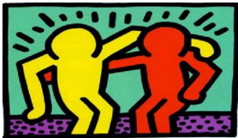
“MEJORES AMIGOS” HARING KEITH