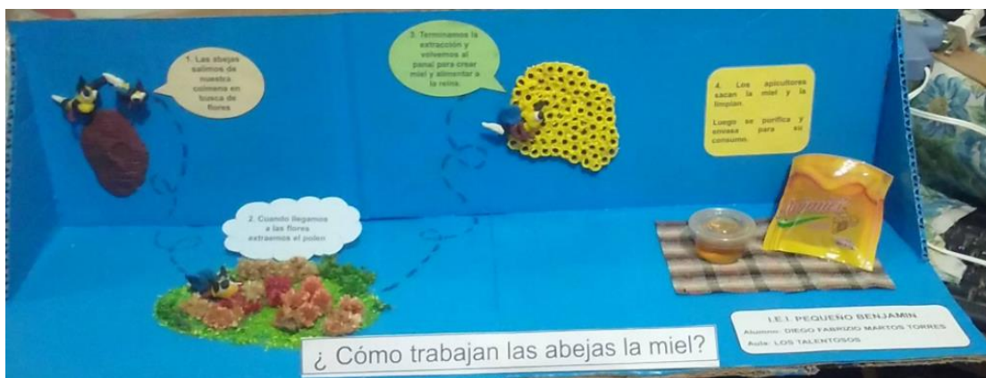
imagen de referencia