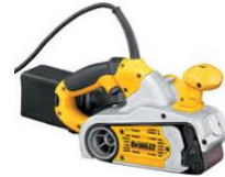
LIJADORA ELECTRICA DE BANDA