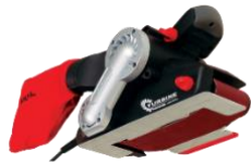
LIJADORA ELECTRICA ORBITAL