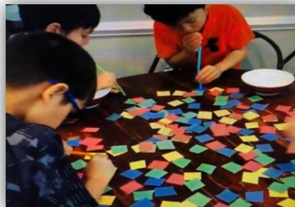
IMAGEN DE EJEMPLO DE JUEGO

El juego puede ser por tiempo. Al finalizar el tiempo, contaremos cuántos papeles tiene cada jugador. El jugador que más papeles tenga ganará.