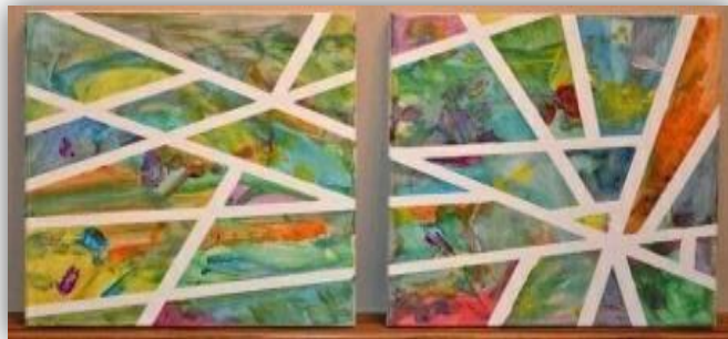
IMAGEN DE EJEMPLO DE ACTIVIDAD FINALIZADA

Una vez terminada la actividad, registraremos fotográficamente el resultado y enviaremos a la Señorita de la sala.