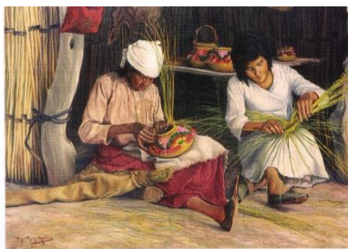
Las Canasteras. Obra de composición 1913

En compañía de la familia observar las imágenes de los Huarpes que serán enviadas por WhatsApp donde muestran su forma de vivir, alimentación, viviendas y vestimenta, con materiales descartables construir una maqueta que represente lo que gustó de los Huarpes.