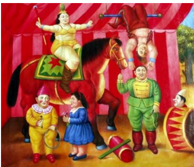
“La gente del circo”