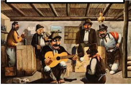
“Pulpería Don Pepe”