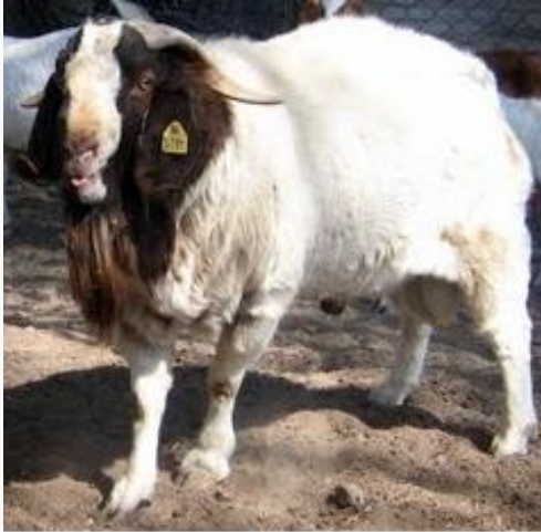
Un semental boer